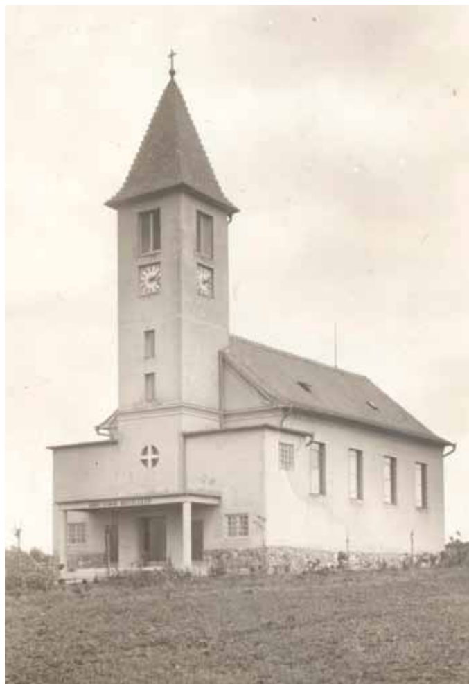
☐ Kostel sv. Cyrila a Metoděje