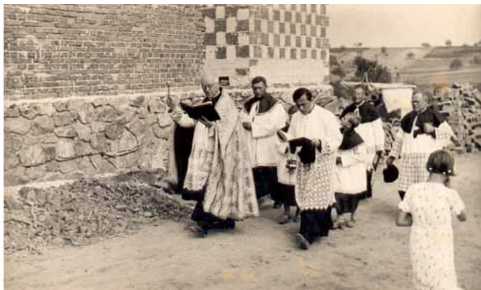
□ Svěcení základního kamene 1936