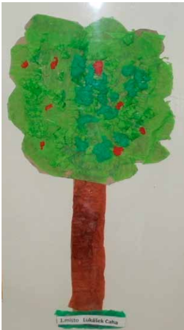
☐ 1. místo ZŠ III - Lukáš Čaha