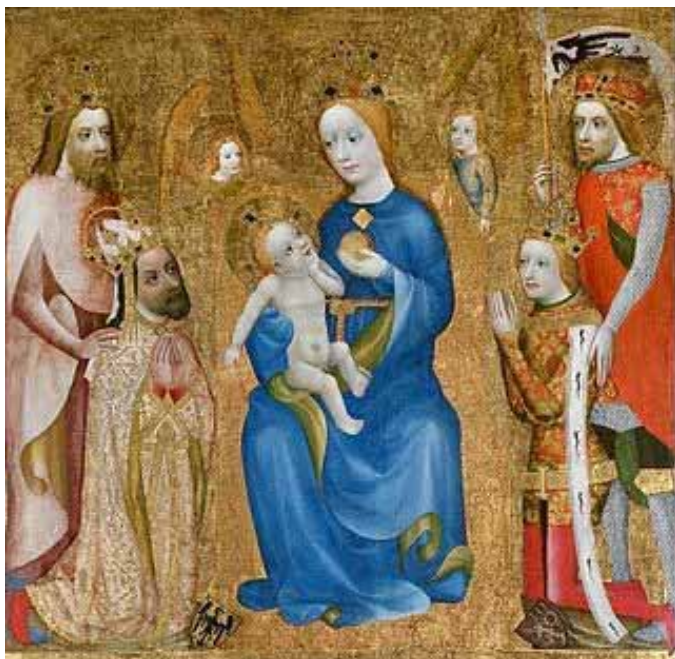
☐ Karel IV. se synem Václavem klečí před Madonou s Ježíškem na Votivním obraze arcibiskupa Jana Očka z Vlašimi z doby kolem roku 1370

Rovněž dárky už patřily ve 14. století ke Štědrému večeru. Nedávaly se však pouze v rodině, ale posílali si je lidé v rámci komunity, přátelé, známí, příbuzní... Darování mělo být obrazem toho, že sám Bůh dal lidem dar největší. Dostal-li někdo dárek, bylo slušností vzkázat poděkování a také něco poslat. Darovat se snažil každý, protože se věřilo, že kdo ten večer nic nedaruje, do roka zchudne.