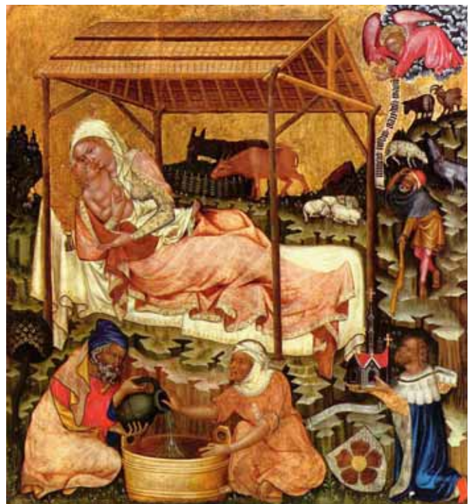
☐ Narození Páně na deskovém obraze Mistra Vyšebrodského oltáře, kolem roku 1350