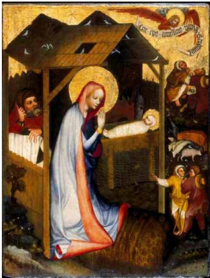
□ Adorace Dítěte na deskové malbě Mistra Třeboňského oltáře, kolem roku 1370