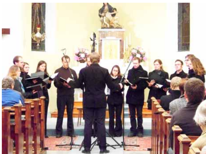
☐ ENSEMBLE VERSUS Brno