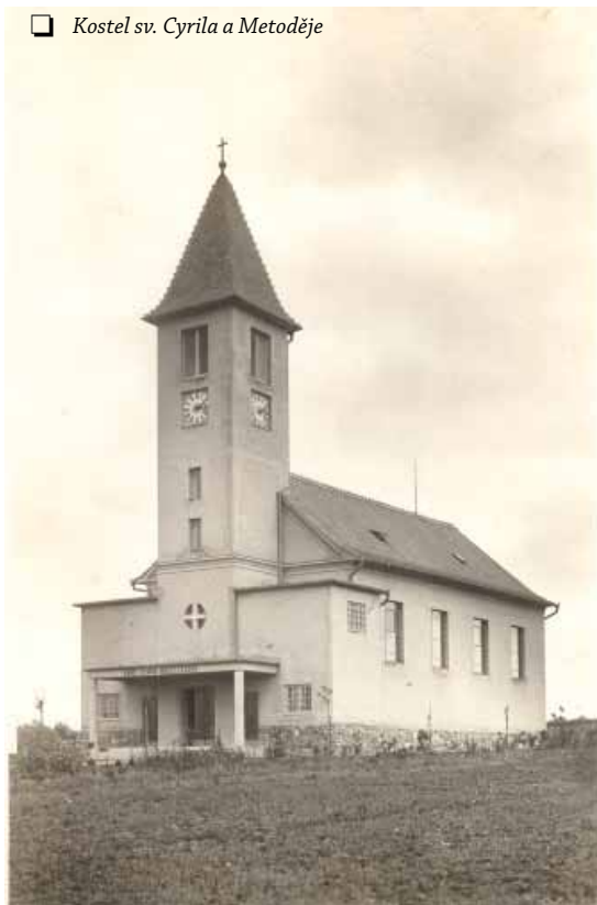
☐ Kostel sv. Cyrila a Metoděje