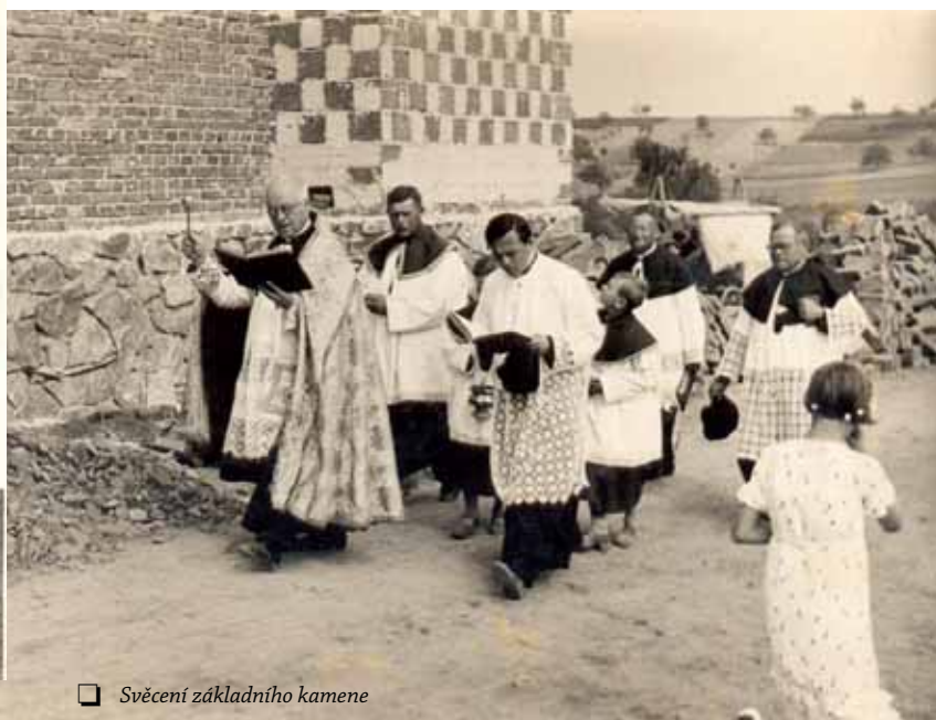
☐ Svěcení základního kamene