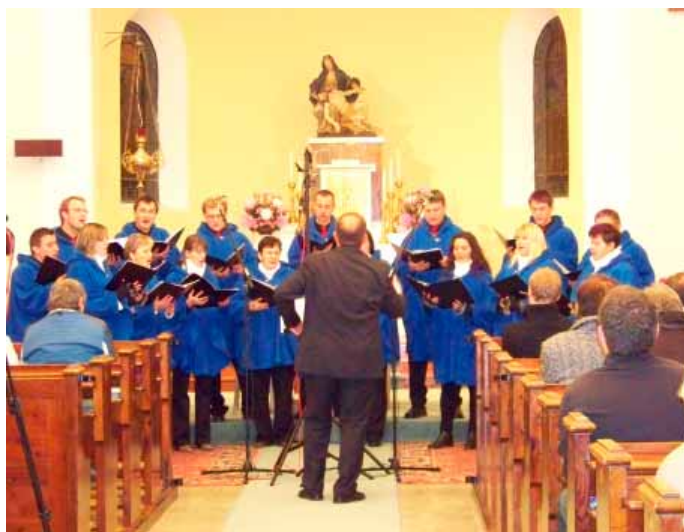
☐ CANTAMUS CORDE