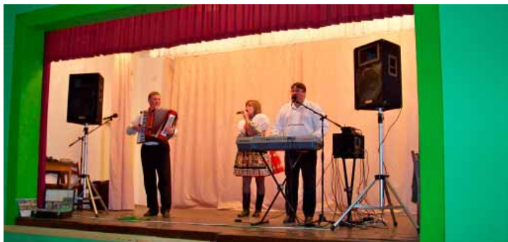
☐ Setkání seniorů

Odpoledne proběhlo v příjemné atmosféře a věříme společně s „organizačním výborem“, že se podobné setkání uskuteční i v příštím roce.