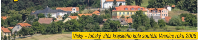
Visky – loňský vítěz krajského kola soutěže Vesnice roku 2008

Do konce dubna se přijímají přihlášky do 15. ročníku soutěže Vesnice roku. Pozornost této zprávy by měli věnovat všichni občané kraje, žijící v obcích, kde se něco děje. Vítězná obec krajského kola může získat zlatou stuhu. Modrá stuha bude udělena za společenský život, bílá za činnost mládeže, zelená za péči o zeleň a životní prostředí a oranžová stuha za spolupráci obce a zemědělského subjektu.