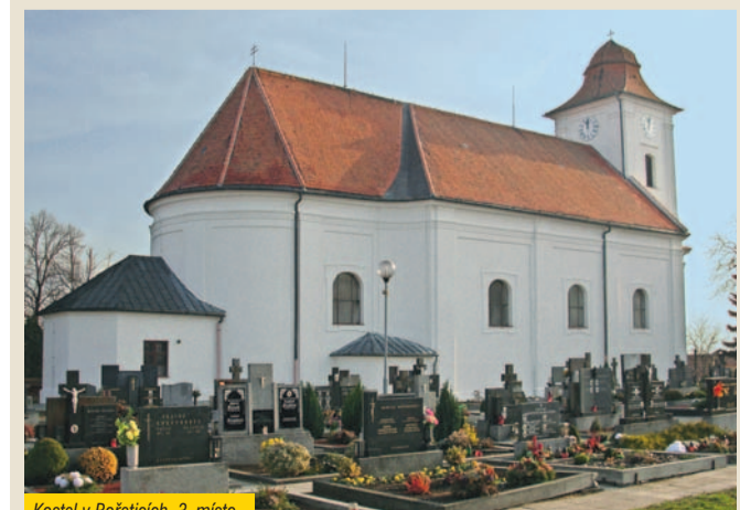
Kostel v Bořeticích, 3. místo

V kategorii webových stránek obcí byly nejuspěšnější Petrovice, druhé místo obsadily Přisroutice. V této kategorii byly uděleny dvě třetí ceny – obcím Senorady a Vavřinec.