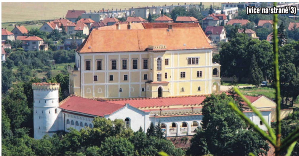
(více na straně 3)

v 16. a 18. století a tyčí se na strmém kopci nad městem, si první místo zasloužil díky obnově fasády, statickému zajištění hlavní budovy či rekonstrukci jízdárny.