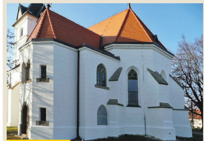
Kostel ve Višňově, 2. místo