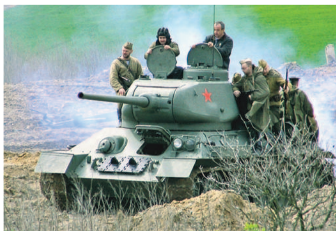
vřavy je připraveno více než 250 kg munice a zkušený tým pyrotechniků

„Akce se zúčastní přes 300 bojovníků německé a Rudé armády a na 20 kusů historických vojenských strojů. Pro dokonalý dojem válečné