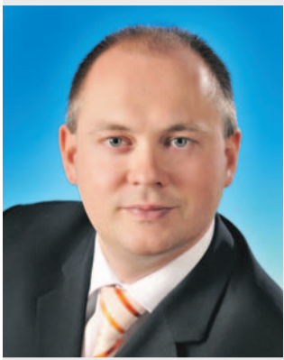
Mgr. Michal Hašek hejtman JMK

Výjezdní zasedání Rady Jihomoravského kraje v Hodoníně – historicky první jednání tohoto orgánu mimo sídlo krajského úřadu v Brně – zahájilo 12. března novou tradici. Ještě když jsme toto zasedání připravovali, řekl jsem novinářům, že rozhodně nepůjde o tradici příjemných celodenních výletů volených funkcionářů kraje, ale o krok směrem k lepšímu poznání jednotlivých okresů. Povede to k rozhodování s větší znalostí místních poměrů a aktuálních potřeb obcí, měst a mikroregionů. Nejde jen o samotný fakt, že se radní kraje sejdou na radnici okresního města. Každého zasedání se zúčastní také starostové pověřených obcí III. stupně z daného okresu, ředitel Úřadu práce, představitel Policie ČR i Hasičského záchranného sboru a jejich informacím mohou naslouchat také přítomní zákonodárci – poslanci i senátoři – zvolení v příštím volebním období. Kromě témat obecné povahy, platných