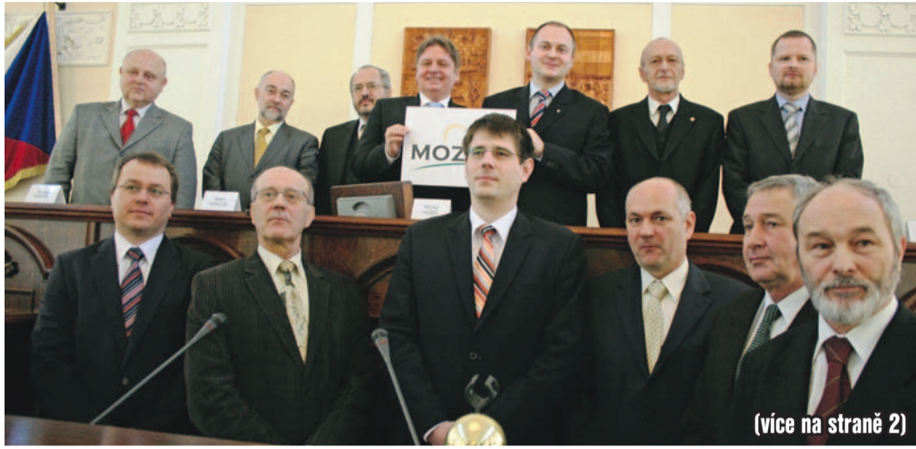
(více na straně 2)

Přípravou krizových scénářů vývoje rozpočtu na rok 2009 a aktualizací rozpočtového výhledu, návrhy strategických opatření k efektivnějšímu nakládání s rozpočtovými prostředky kraje a fungování organizací zřízených krajem se bude zabývat pracovní skupina pro přípravu kraje na zmírnění dopadů hospodářské