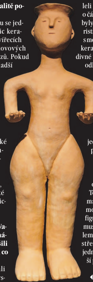
◀ Hedvika – možná podoba

leli jsme, že se jedná o část mísy na nožce – ty byly jedním z charakteristických tvarů kultury s moravskou malovanou keramikou. Měla však divné ukončení a část byla odlomená. Dali jsme ji bokem a kopali dál. Při začišťování stěny se najednou objevily duté trubkovité předměty a po očišťování se ukázalo, že se jedná o hýždě z velké plastiky. Blesklo mi hlavou, že předchozí nález k tomu patří, a opravdu k sobě okamžitě pasovaly. To už jsme věděli, že máme absolutně mimořádný kus ženské figurální plastiky, která musela mít původně kolem 60 centimetrů. Ve středním Podunají se jedná o doposud největší podobný nález.